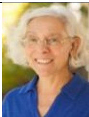
Donna San Antonio

Ricercatore e studioso di fama internazionale in ambito educativo e della valutazione e autore di importanti pubblicazioni